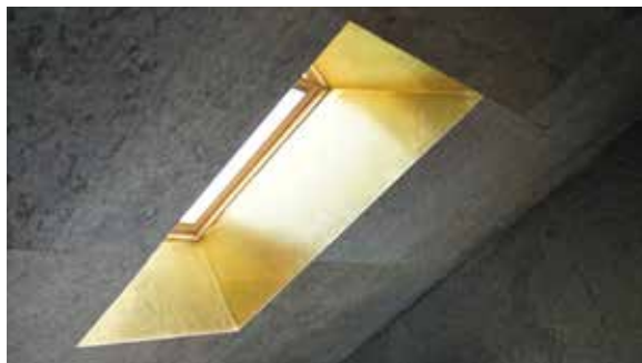
Castle Hotel Daniel, Бараолт КМЕ Natural медни ламарини и интериорен дизайн