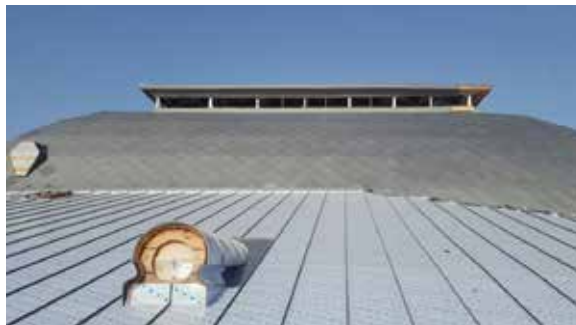
Театър Maria Filotti, Браила Титан-цинкови ламарини ElZinc 'Slate'