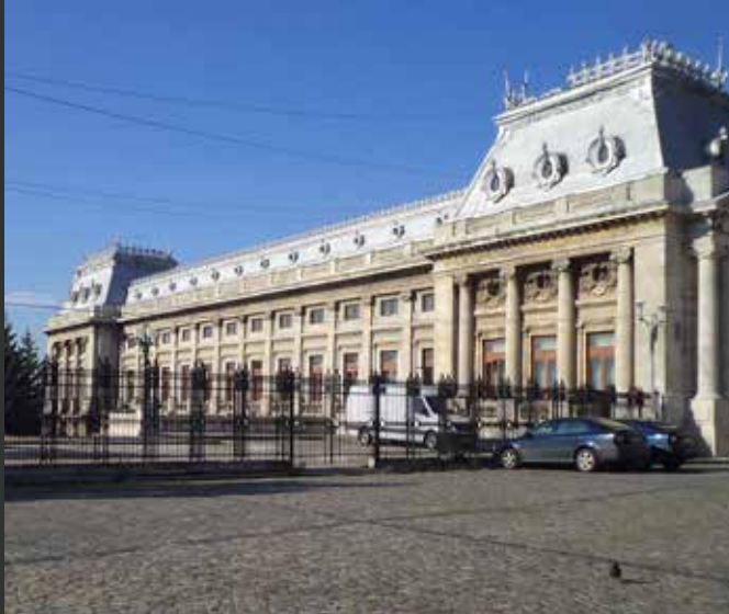
Дворецът на Патриаршията, Букурещ