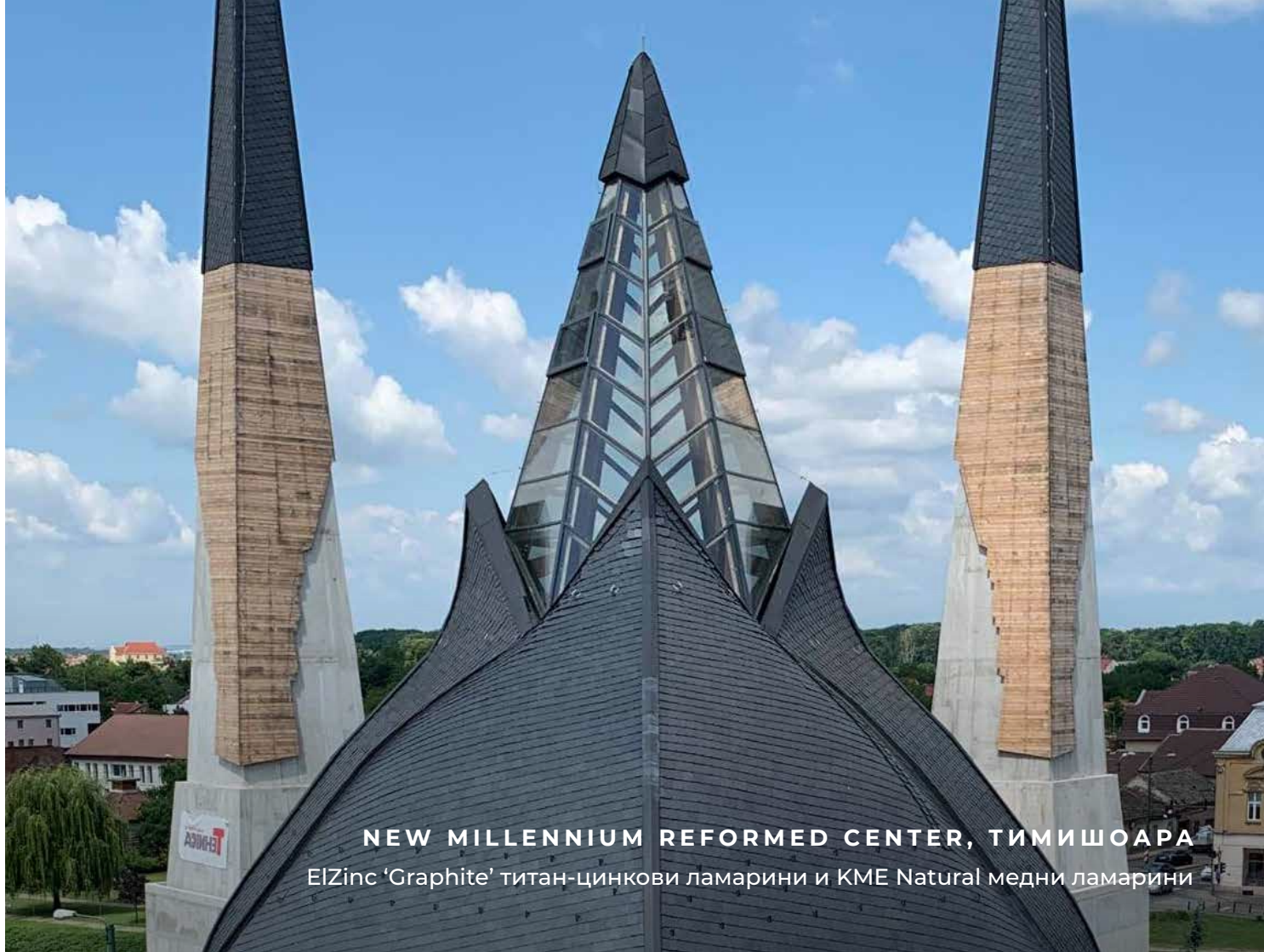
NEW MILLENNIUM REFORMED CENTER, ТИМОШАРА ElZinc 'Graphite' титан-цинкови ламарини и KME Natural медни ламарини