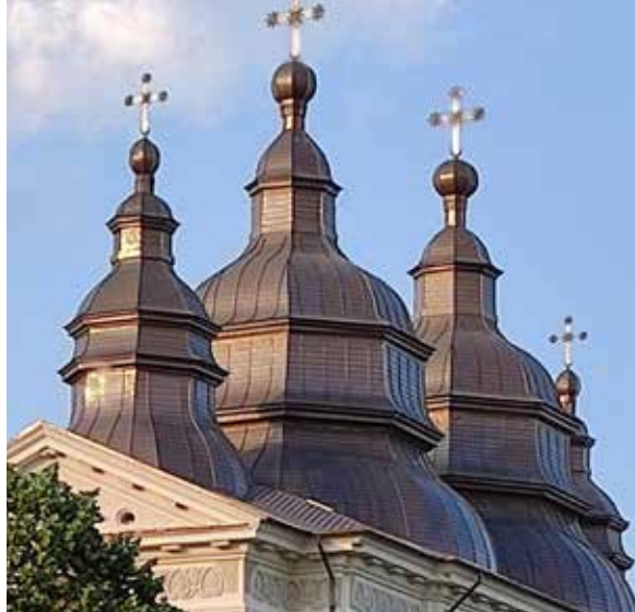
Mănăstirea Frumoasa, Iași / Tablă cupru KME