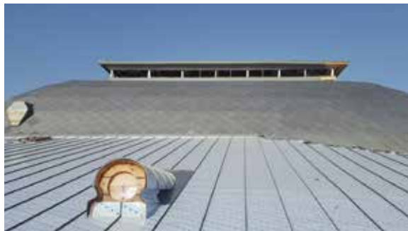
Teatrul Maria Filotti, Brăila Tablă titan-zinc prepatinat elZinc 'Slate'